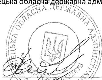
Павло Жебрівський Голова Донецької обласної державної адміністрації